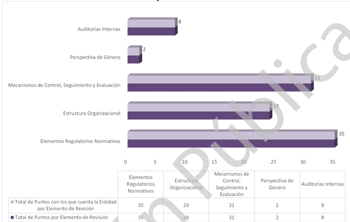
Grafica 1 Cumplimiento de los Mecanismos de Control Interno Ejercicio 2020